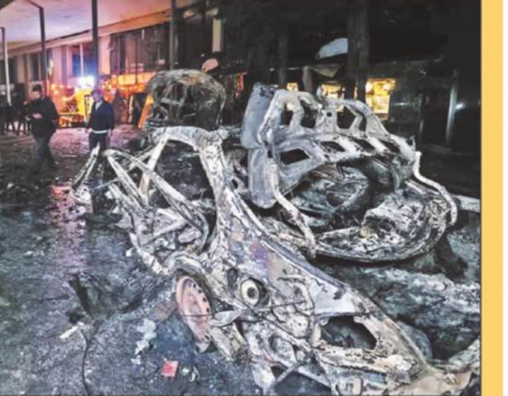
यूक्रेन के खारकीव में रूसी ड्रोन हमले के बाद इलाके में मलबा नजर आया।