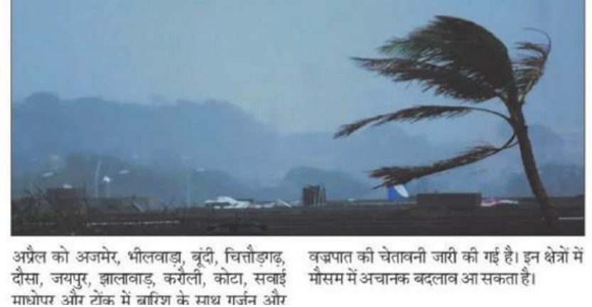
अप्रैल को अजमेर, भीलवाड़ा, बूंदी, चित्तौड़गढ़, दौसा, जयपुर, झालावाड़, करौली, कोटा, सवाई माधोपुर और टोंक में बारिश के साथ गर्जन और वज्रपात की चेतावनी जारी की गई है। इन क्षेत्रों में मौसम में अचानक बदलाव आ सकता है।

अप्रैल को मौसम में बड़ा बदलाव हो सकता है। राज्य के 15 जिलों में बारिश और आंधी की संभावना है। इन जिलों में तेज हवाओं के साथ हल्की बारिश हो सकती है। यह बदलाव राजस्थान में बड़ती गर्मी से राहत दिला सकता है, लेकिन इसके साथ ही मौसम में अस्थिरता भी आ सकती है। मौसम विभाग के मुताबिक 5 अप्रैल को फिर से मौसम में बदलाव होगा और तापमान में वृद्धि हो सकती है। राजस्थान में 1 से 3 अप्रैल के बीच राज्य के दक्षिण-पूर्वी इलाकों में बादल छाए रहेंगे, जबकि उत्तर राजस्थान में हल्की से तेज हवाएं 20-30 किमी/घंटा की रफ्तार से चल सकती हैं। 2 अप्रैल को बार, भीलवाड़ा, बूंदी, चित्तौड़गढ़, झालावाड़ और कोटा में बारिश की संभावना है। जबकि 3